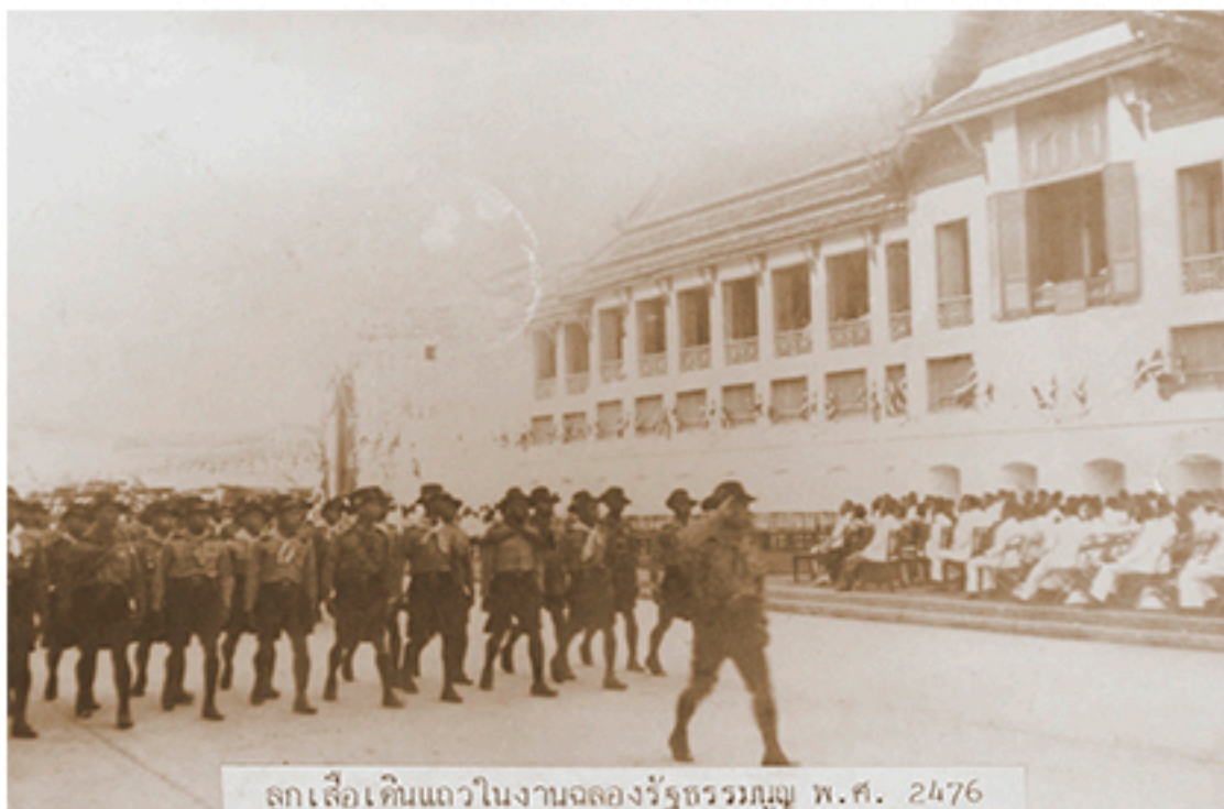
ลูกเสือเดินแถวในงานฉลองรัฐธรรมนูญ พ.ศ. 2476