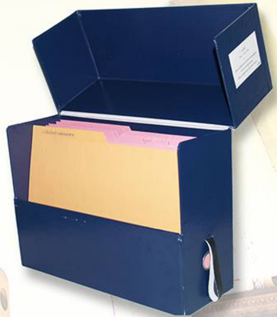
กล่องข้อมูลเอกสารทางประวัติศาสตร์