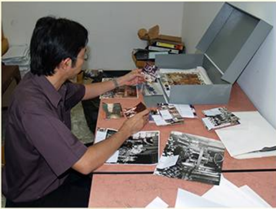
ข้อมูลรูปแบบภาพถ่าย

เป็นคลังข้อมูลทางประวัติศาสตร์ด้านนิติบัญญัติของรัฐสภา มีหน้าที่รวบรวมเอกสารที่เกิดจาก กระบวนการดำเนินงานของรัฐสภาในทุกบริบท ทุกขั้นตอน ทุกเหตุการณ์ และทุกช่วงเวลา ปราบกฏใน หลายลักษณะ ทั้งรูปแบบเอกสารกระดาษ เอกสารอิเล็กทรอนิกส์ ภาพถ่าย สื่อโสตทัศน์ ซึ่งเป็นหลักฐาน ของการดำเนินงานตามอำนาจหน้าที่ของรัฐสภา