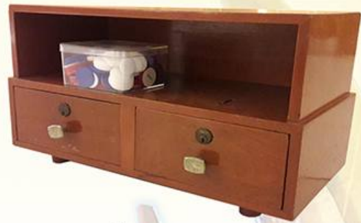
ตู้เก็บลงคะแนน