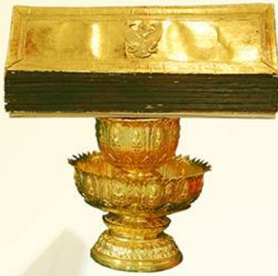
พานรัฐธรรมนูญ

รวบรวมเก็บรักษาและจัดแสดงวัตถุ เอกสารต่าง ๆ ที่เป็นประวัติศาสตร์ทางการเมืองการปกครองของไทยตามระบอบประชาธิปไตยในระบอบรัฐสภา พร้อมจัดแสดงและให้บริการนำชม รวมทั้งเผยแพร่ความรู้ด้านการเมืองการปกครองในรูปแบบการจัดนิทรรศการและกิจกรรมส่งเสริมการเรียนรู้