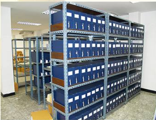
คลังข้อมูลทางประวัติศาสตร์