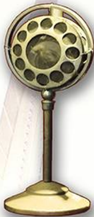
ไมโครโฟนใช้ในห้องประชุม