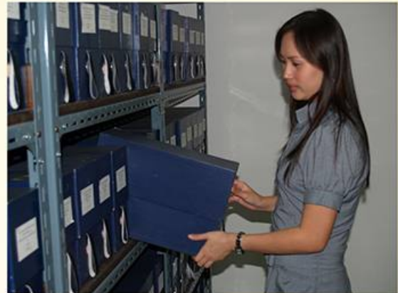
ข้อมูลรูปแบบเอกสารกระดาษ