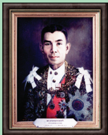
ภาพ พระยามานวราชเสวี

ส่วนในสมัยประชุมสามัญประจำปี พ.ศ. 2479 ได้มีพระราชกฤษฎีกาเรียกประชุมสมัยสามัญแห่งสภาผู้แทนราษฎร ในวันที่ 1 สิงหาคม และที่ประชุมสภาผู้แทนราษฎร ครั้งที่ 1/2479 เมื่อวันที่ 3 สิงหาคม ที่ประชุมได้เลือก พระยามานวราชเสวี (ปลอด-วิเชียร ฌสงขลา) เป็นประธานสภาผู้แทนราษฎร นายพันเอก พระประจันปัจจนึก (พุก มหาตลล) เป็นรองประธานสภาผู้แทนราษฎร คนที่ 1 และนายพลโท พระยาเทพหัสดิน (ผาด เทพหัสดิน ฌอยุธยา) เป็นรองประธานสภาผู้แทนราษฎร คนที่ 2