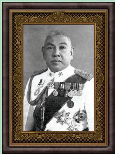
ภาพ พระยาพหลพลพยุหเสนา

ในวันถัดมาได้มี “ประกาศตั้งนายกรัฐมนตรี” โดยทรงพระกรุณาโปรดเกล้าฯ ให้ “พระยาพหลพลพยุหเสนา” เป็น นายกรัฐมนตรี (สมัยที่ 2) โดยมีรัฐมนตรีร่วมคณะ จำนวน 19 ตำแหน่ง และรัฐบาลได้แถลงนโยบายต่อสภาเมื่อวันที่ 25 ธันวาคม ซึ่งเป็นครั้งแรกของไทยที่คณะรัฐมนตรีได้แถลงนโยบายต่อสภาผู้แทนราษฎรที่มาจาก การเลือกตั้ง (ทางอ้อม) โดยที่ประชุมสภา ได้ยกมือเพื่อลงมติไว้วางใจในนโยบายของรัฐบาลเป็นเอกฉันท์