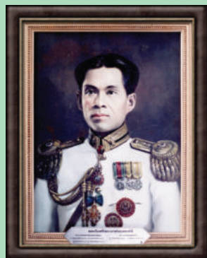
ภาพ พลเรือตรี พระยาศรยุทธเสนี

ต่อมาเจ้าพระยาธรรมศักดิ์มนตรีได้ลาออกจากตำแหน่งและสมาชิกภาพ (เพราะป่วย) ที่ประชุมสภาเมื่อวันที่ 26 กุมภาพันธ์ 2476 จึงได้เลือกนายพลเรือตรี พระยาศรยุทธเสนี เป็นประธานสภาแทน ส่วนตำแหน่งรองประธานสภาผู้แทนราษฎร คนที่ 1 ที่ว่างนั้น ไม่ได้มีการเลือกตั้งแทน อย่างไรก็ตาม ในเวลาต่อมาท่านได้ขอลาออกจากตำแหน่ง เพราะได้รับแต่งตั้งให้ดำรงตำแหน่งรัฐมนตรีว่าการกระทรวงเศรษฐการ ที่ประชุมสภา เมื่อวันที่ 22 กันยายน 2477 จึงได้เลือกเจ้าพระยาศรีธรรมมาธิเบศเป็นประธานสภาแทน