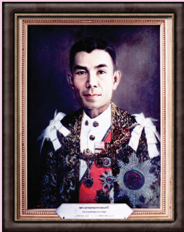
ภาพ พระยามานวราชเสวี (ปลอด-วิเชียร ณ สงขลา)

ในปีถัดมาได้มีการตรา “พระราชกฤษฎีกาเรียกประชุมสามัญแห่งสภาผู้แทนราษฎร พุทธศักราช 2481” โดยกำหนดเปิดประชุมในวันที่ 24 มิถุนายน และสภาได้ประชุม ครั้งที่ 1/2481 เมื่อวันที่ 25 มิถุนายน ที่ประชุมสภาได้เลือกพระยามานวราชเสวี (ปลอด-วิเชียร ณ สงขลา) เป็นประธานสภาผู้แทนราษฎร และพระยาวิฑูรธรรมพิเนต (โต๊ะ อัมระนันท์) เป็นรองประธานสภาผู้แทนราษฎร ซึ่งเป็นไปตามมติของที่ประชุมที่ให้มีรองประธานสภาเพียงตำแหน่งเดียว