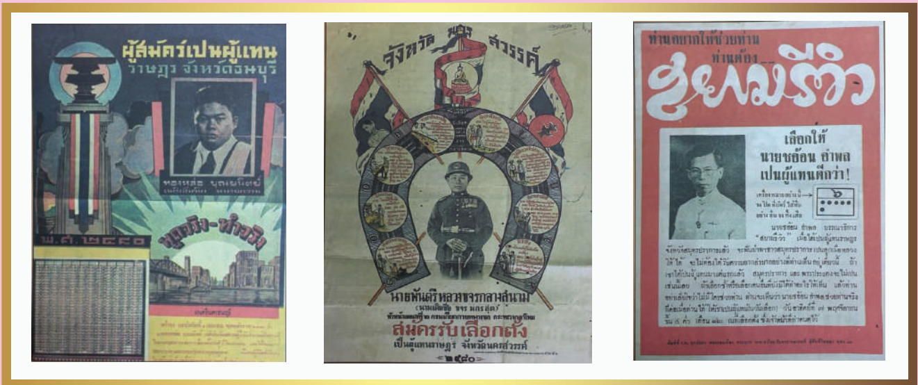
ภาพ ป้ายหาเสียงของผู้สมัครเลือกตั้งโดยตรงครั้งแรก

1.4 “พระราชกฤษฎีกาแบ่งเขตเลือกตั้ง พุทธศักราช 2480” ได้กำหนดให้จังหวัดที่แบ่งเขตเลือกตั้งออกเป็น 4 เขต คือ จังหวัดอุบลราชธานี จังหวัดที่แบ่งเขตเลือกตั้งออกเป็น 3 เขต ได้แก่ จังหวัดพระนคร จังหวัดเชียงใหม่ จังหวัดนครราชสีมา และ จังหวัดมหาสารคาม และจังหวัดที่แบ่งเขตเลือกตั้งออกเป็น 2 เขต คือ จังหวัดขอนแก่น จังหวัดชุมพร (เปลี่ยนชื่อเป็นจังหวัดศรีสะเกษ เมื่อวันที่ 14 พฤศจิกายน 2481) จังหวัดเชียงราย จังหวัดนครศรีธรรมราช จังหวัดนครสวรรค์ จังหวัดพระนครศรีอยุธยา จังหวัดร้อยเอ็ด จังหวัดลำปาง จังหวัดสงขลา และจังหวัดสุรินทร์ รวมมีจังหวัดที่แบ่งเขตเลือกตั้งมากกว่า 1 เขต จำนวน 15 จังหวัด/36 เขต ส่วนจังหวัดอื่นอีก 55 จังหวัดมี 1 เขต รวมมีจังหวัดทั้งสิ้น 70 จังหวัด/91 เขต