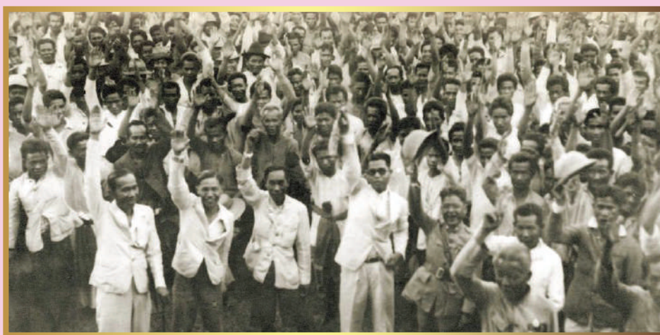
ภาพ การเลือกตั้งใหญ่ครั้งที่ 2 ของประเทศไทย

“ ด้วยในการประชุมเมื่อวันเสาร์ที่ 10 กันยายน ศกนี้ สภาผู้แทนราษฎรได้พิจารณาญัตติของสมาชิกฯ ขอแก้ไขข้อบังคับการประชุมและการปรึกษาของสภาผู้แทนราษฎร ข้อ 68 เกี่ยวกับการเสนอร่างพระราชบัญญัติงบประมาณเพื่อพิจารณารับหลักการขั้นต้นในสภาผู้แทนราษฎร ผู้เสนอต้องการให้แสดงบัญชีรายละเอียดแสดงหลักเกณฑ์การคำนวณภาษีอากร สลิติต่าง ๆ จำนวนคน และรายละเอียดอื่น ๆ อีกเป็นอันมาก...แม้จะได้แสดงให้เห็นทางเสียหายที่ประเทศชาติจะได้รับในการแก้ไขข้อบังคับเช่นนี้ก็ดี ผู้ได้แย้งก็ยังหาสนใจที่จะฟังเหตุผลไม่...สมาชิกฝ่ายผู้แทนราษฎรก็เสนอญัตติให้รวบรัดการพิจารณาและเสนอให้ลงมติโดยไม่ให้อีกาสรัฐบาลแถลงชี้แจงอีก วิธีการตั้งนี้เป็นวิธีช่วงชิงเอาเปรียบโดยไม่เป็นธรรมในที่สุดสภาฯ ได้ลงมติรับหลักการแห่งร่างข้อบังคับนั้น...นายกรัฐมนตรีได้เสนอเรื่องนี้แต่คณะผู้สำเร็จราชการแทนพระองค์ให้ทราบความประสงค์ของคณะรัฐมนตรีที่จะขอลาออกจากหน้าที่ แต่คณะผู้สำเร็จราชการแทนพระองค์เห็นว่าสภาพการของโลกในเวลานี้อยู่ในระหว่างความปั่นป่วนคับขัน ประกอบกับจะต้องเตรียมการรับเสด็จสมเด็จพระเจ้าอยู่หัวเสด็จสู่พระนคร รัฐบาลคณะนี้ควรจะบริหารราชการของประเทศต่อไป เมื่อเป็นเช่นนี้รัฐบาลก็เห็นมีทางเดียวที่จะดำเนินการตามวิธีรัฐธรรมนูญ คือ ยุบสภาผู้แทนราษฎร เพื่อเป็นทางที่ราษฎรจะได้เลือกตั้งผู้แทนมาใหม่ ดังที่ได้ประกาศในพระราชกฤษฎีกาแล้ว ”