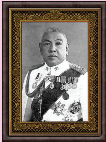
ภาพ พระยาพหลพลพยุหเสนา

เมื่อวันที่ 21 ธันวาคม 2480 ได้มีพระบรมราชโองการประกาศตั้งนายกรัฐมนตรี คือ นายพันเอก พระยาพหลพลพยุหเสนา (พจน์ พหลโยธิน) และประกาศตั้งรัฐมนตรี 18 นาย ประกอบด้วย รัฐมนตรีว่าการ จำนวน 8 นาย รัฐมนตรีช่วยว่าการ จำนวน 3 นาย และรัฐมนตรี จำนวน 7 นาย นับเป็นคณะรัฐมนตรีคณะที่ 8 และเป็นการดำรงตำแหน่งนายกรัฐมนตรีของนายพันเอก พระยาพหลพลพยุหเสนา (พจน์ พหลโยธิน) สมัยสุดท้าย